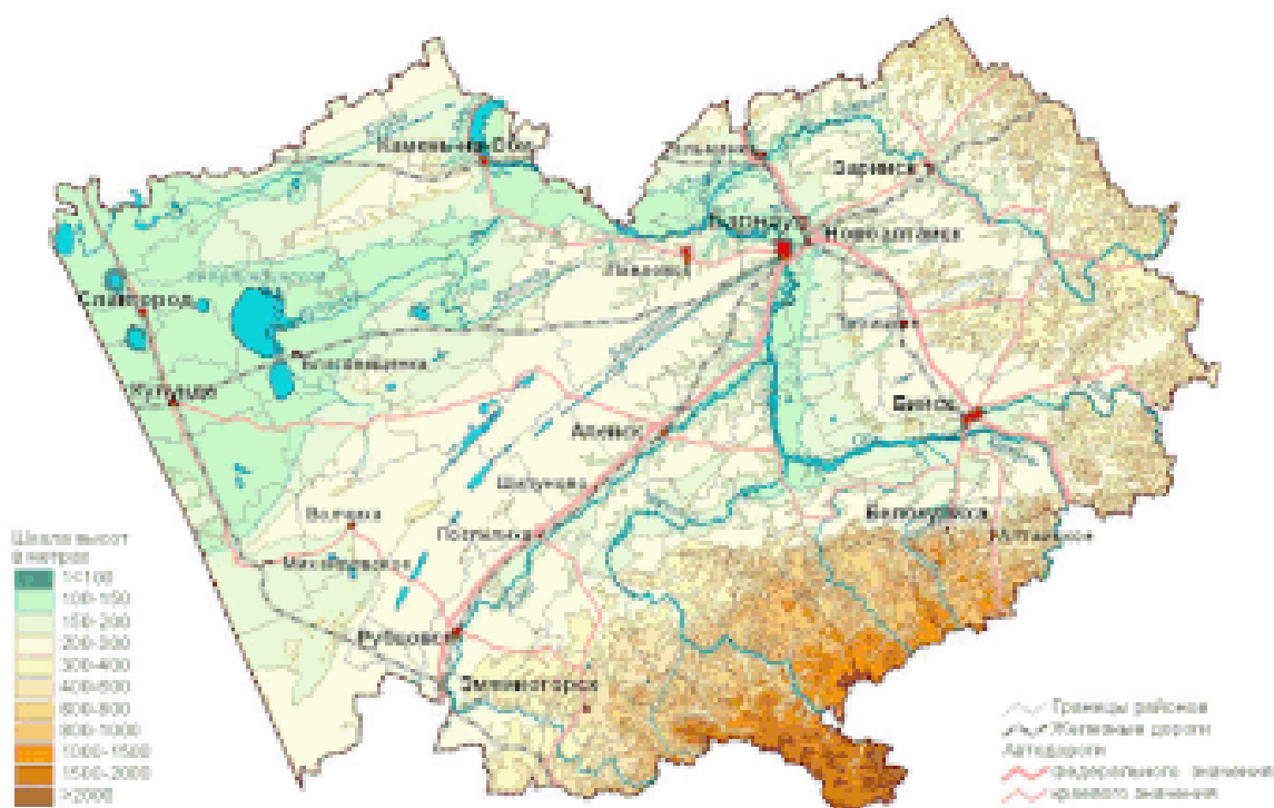
Физическая карта Алтайского края