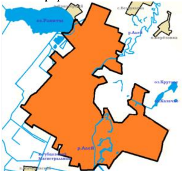
Город Рубцовск на карте

Расположен в Алейской степи ( Предалтайская равнина ), на левом берегу реки Алей (приток Оби ), в 290 км к юго-западу от Барнаула . Находится в 40 км от границы с Казахстаном , однако статуса пограничного города не имеет.